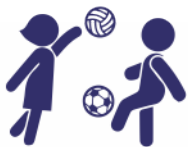
Excursões ao clube (Jogos da Paz)