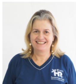
CINARA Português e Literatura