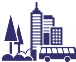
Trabalhos de campo