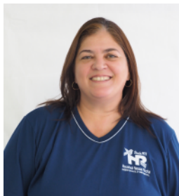
CARMEN Português e Literatura