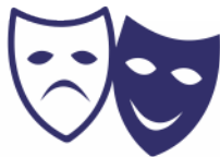
Ensaaios para apresentações em teatros