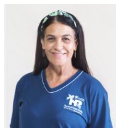
CLEUSA Serviço de apoio