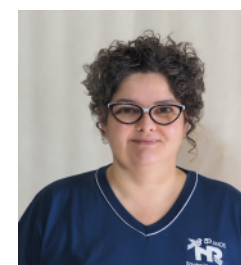
TEREZA Artes Visuais