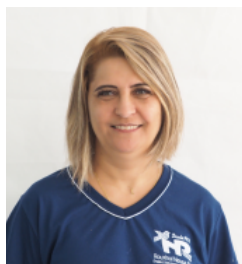
LENE Assistente da coordenação Secretária